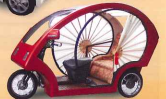
あっぱれEVプロジェクト オリジナル電気自動車(EV)